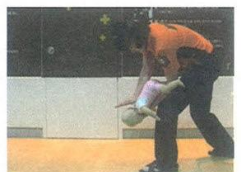
영아 기도폐쇄 응급처치