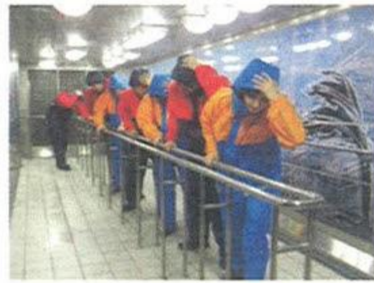
비 · 바람 체험

최고 30m/s의 강풍과 300mm/h의 비를 동반한 태풍의 위력을 체험하고 태풍발생 전 준비사항 및 발생 후 대피 요령을 배울 수 있습니다.